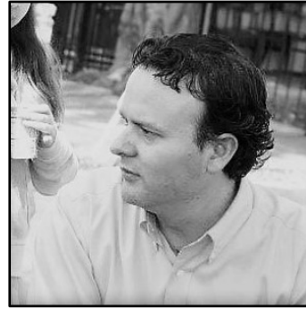
Alor Calderon Employee Rights Center, San Diego