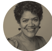
Deogracia Cornelio Warehouse Workers Resource Center