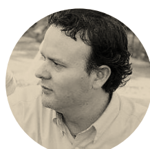
Alor Calderon Employee Rights Center